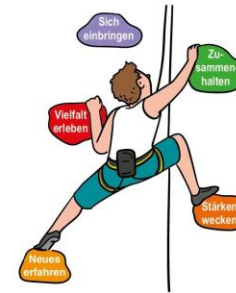
Dein Recht auf Bildung