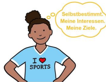
Dein Recht auf Schutz vor Ausbeutung