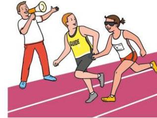
Dein Recht auf ein aktives Leben mit Behinderung