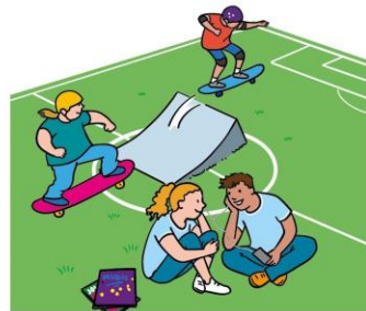
Dein Recht auf Spiel, Freizeit und Erholung