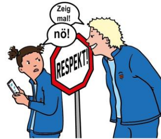
Dein Recht auf Privatsphäre