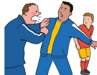
Dein Recht auf Schutz vor Gewalt