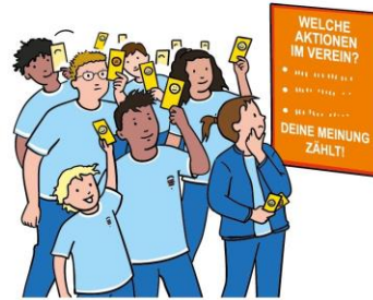
Dein Recht auf Mitbestimmung