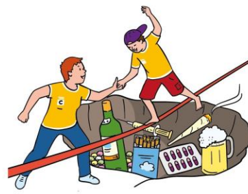
Dein Recht auf Schutz vor Drogen